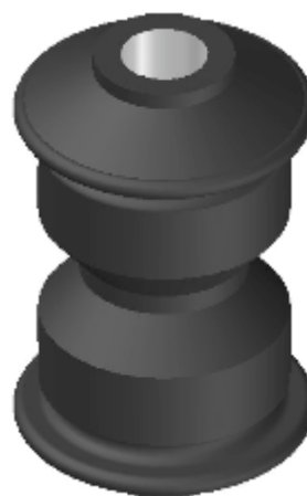
BUCHA SUSPENSÃO TRASEIRA P/ DIANTEIRA 709, 912, 914 E 915-C

ARTEFATOS DE BORRACHA PRODUZIDOS EM BORRACHA 70 SHORE, TUBO SAE 1020 E TECIDO NYLON, PRODUTOS DE ALTA QUALIDADE E ÓTIMO ACABAMENTO. ATUAM NAS EXTREMIDADES DAS LÂMINAS E JUMELOS DISTRIBUINDO E ABSORVENDO IMPACTO CAUSADO POR ONDULAÇÕES NAS PISTAS DE ROLAMENTO.