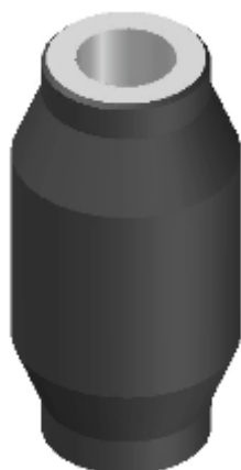
BUCHA TRASEIRA P/ DIANTEIRA F-4.000 MOD.