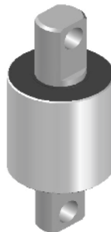
BUCHA C/ PINO TIRANTE DA SUSPENSÃO GUERRA